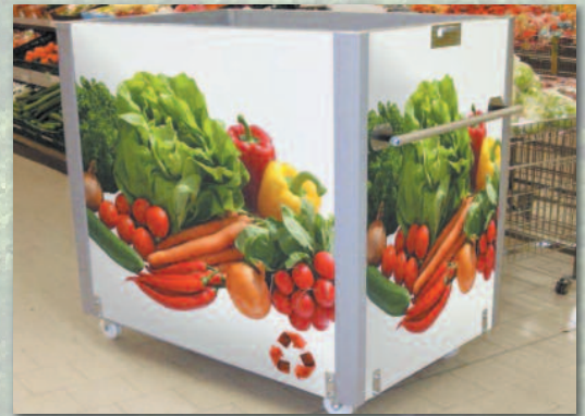
Chariot à votre image – en option Possibilité d'avoir plusieurs chariots