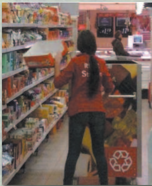
Les chariots de collecte décorés permettent de véhiculer une image d'ordre et de professionnalisme.