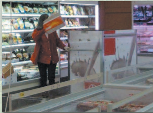
Pas d'impact négatif sur les clients via un processus de collecte qui semble improvisé.