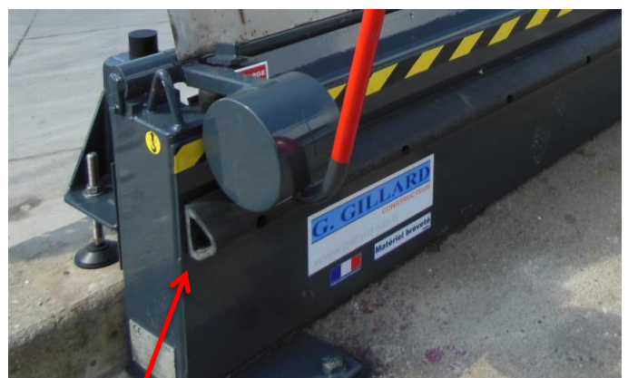
Tampon caoutchouc anti chocs/véhicules