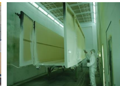
Cabine de peinture