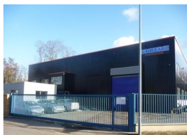
Atelier de Chaudronnerie