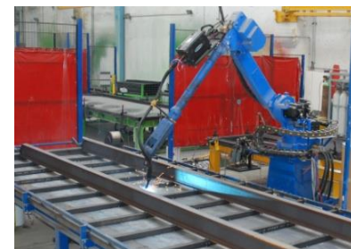
Robot de soudure