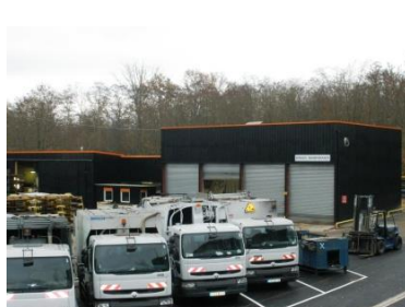
Atelier de Maintenance