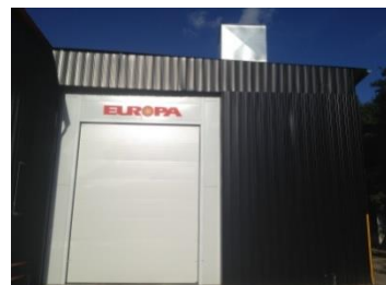
Cabine de peinture