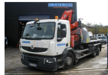
Camion à bras