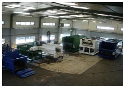
Atelier de Montage