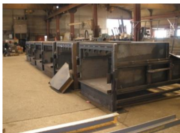
Atelier de Chaudronnerie