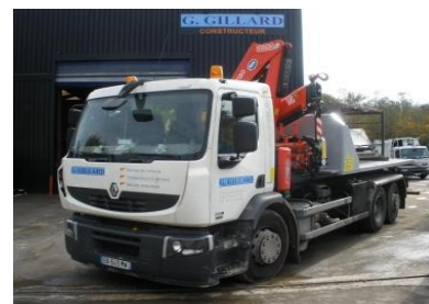
Camion à bras