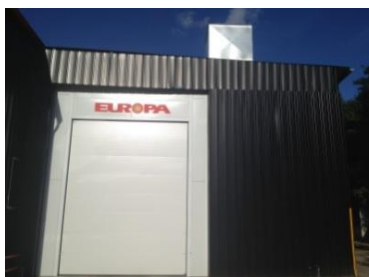
Cabine de peinture