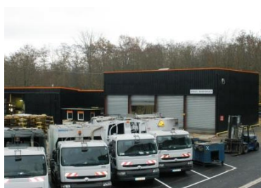
Atelier de Maintenance