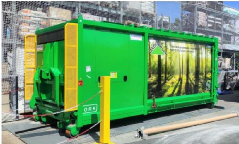
Compacteur ORK de Leroy Merlin

Le groupe Ravate poursuit son objectif de gestion efficace, fiable et performante de déchets ! R2D2, entité du groupe chargée du traitement des déchets, a ainsi procédé à l'installation de deux nouveaux compacteurs ORK 3 sur les sites des magasins Leroy Merlin de Sainte-Marie et de Saint-Louis. Produites par la société de renom Gillard. L'enseigne acquiert ainsi, les deux premières machines de l'océan Indien, avec une capacité de 30 m3 au lieu de 20 m3 habituellement, pouvant compacter des déchets tels que la ferraille, les encombrants, les cartons de grande taille, etc.