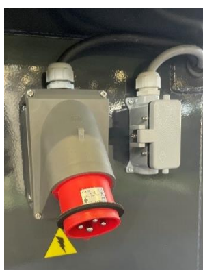
• Prises d'alimentation