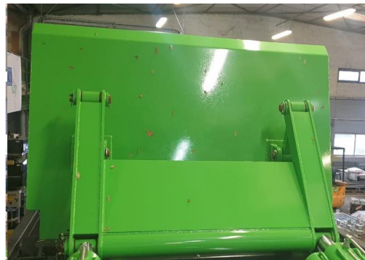
• Pelle levée