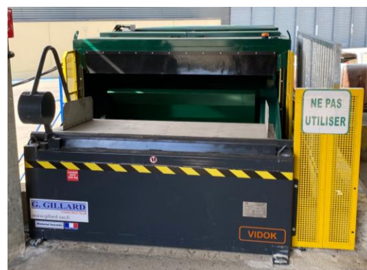
• Barrière de sécurité