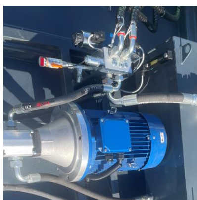
• Centrale hydraulique et armoire électrique sur le toit