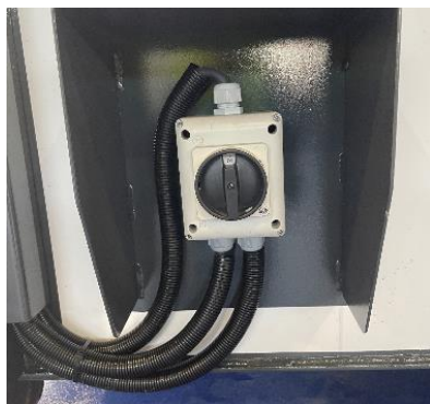
• Inverseur de phase