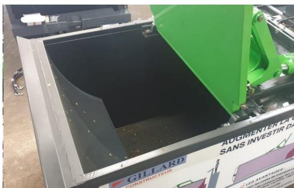
• Auget vue de dessus