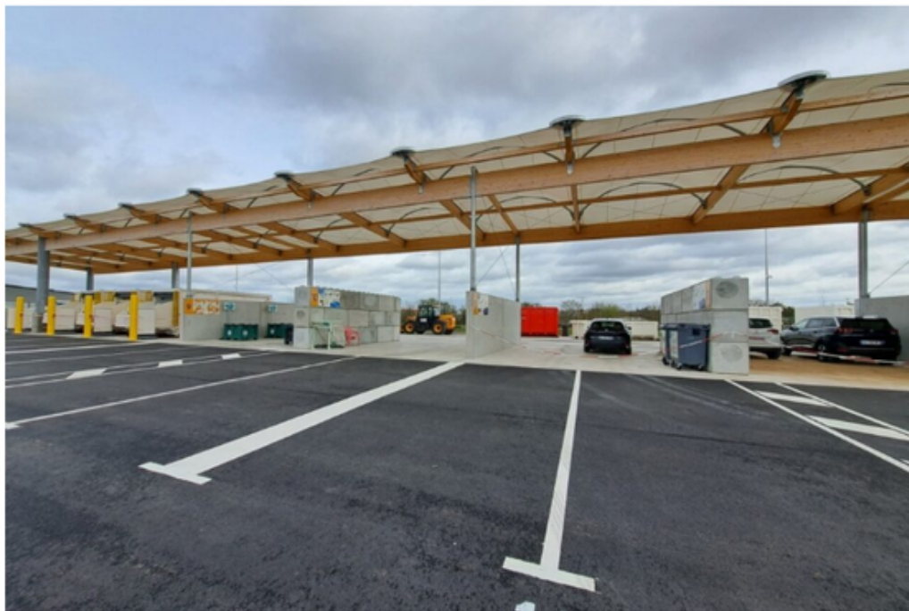
La nouvelle déchèterie de Colombelles.

La nouvelle déchèterie de Colombelles (Calvados), ouvre ses portes aux particuliers comme aux professionnels lundi 18 mars 2024, avec quelques nouveautés.