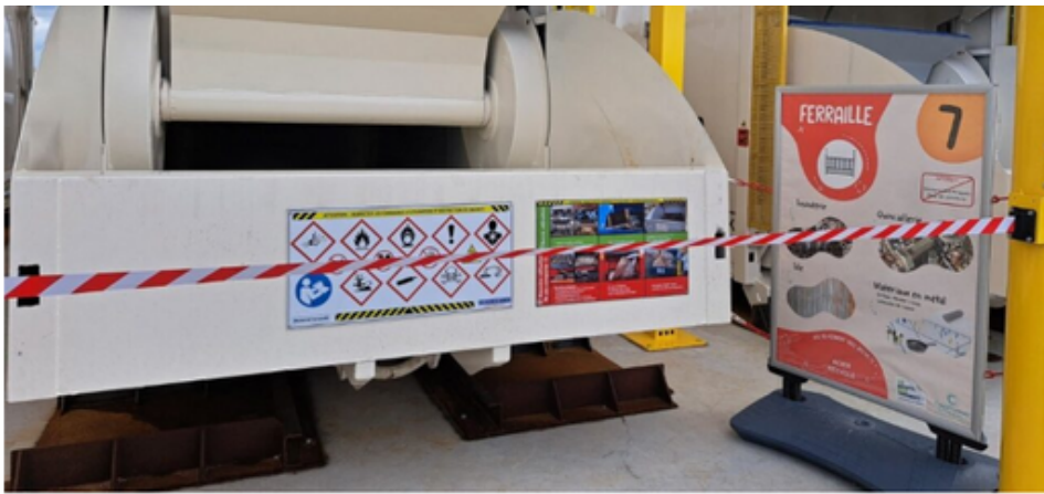
Trois compacteurs comme celui-ci sont dédiés pour le bois, la ferraille et le carton à la nouvelle déchèterie de Colombelles.