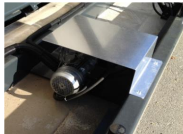
• Micro-centrale hydraulique protégée