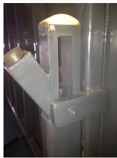
• Système de basculement Breveté