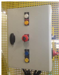
• Pupitre de commandes

La nouvelle réglementation en vigueur, relative à la sécurisation des hauts de quai a amené la Société Gillard à concevoir un système de sécurisation qui améliore l'ergonomie tant pour les utilisateurs que pour le responsable de la déchetterie.