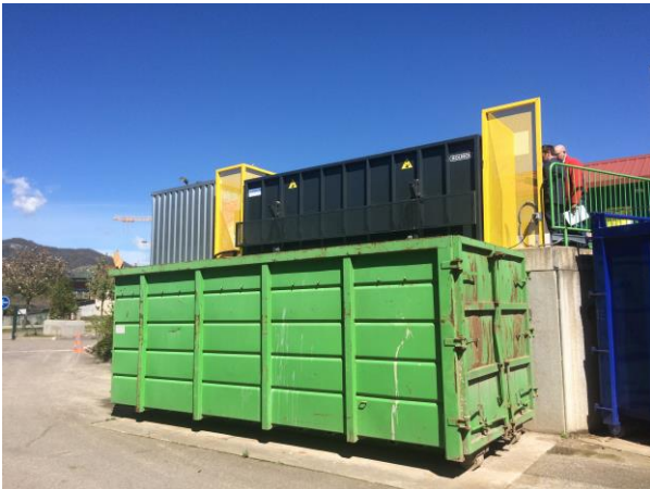
Vue du bas de quai