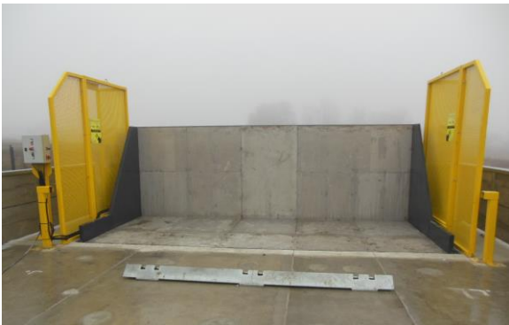
Butée de roues en acier galvanisé à chaud