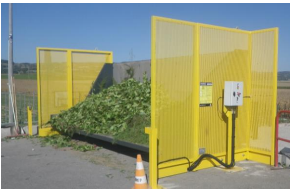
Version rallongée pour déchets verts