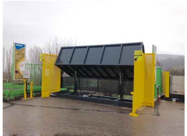
Phase de vidage