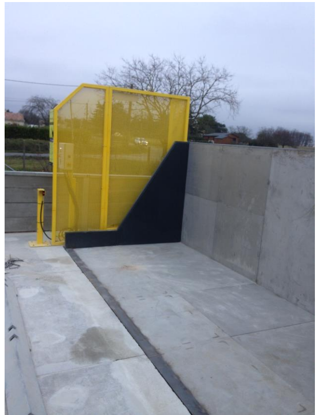
Version rallongée et encastrée dans le sol avec plat de recouvrement