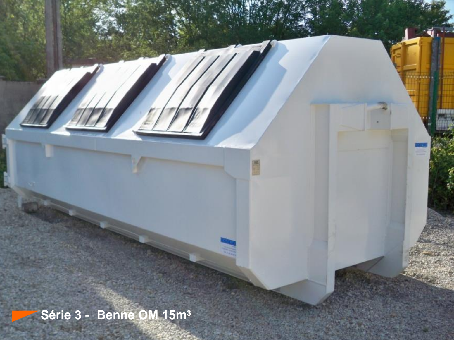
Série 3 - Benne OM 15m 3