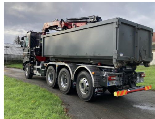
• Benne ROK - 15 m 3 sur porteur