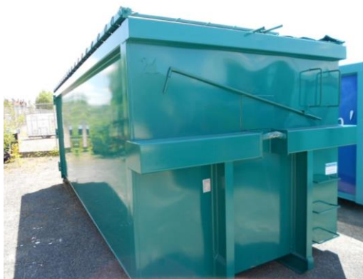
• Benne ROK - 30m 3 Toits filets manuel