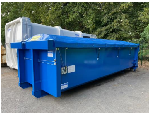
• Benne ROK - 15 m 3 Toit bâché