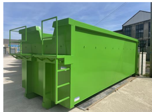
• Benne ROK - 30 m 3 Avec plateforme avant