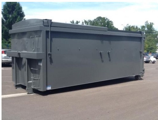
• Benne ROK - 30m 3 Toits coulissants