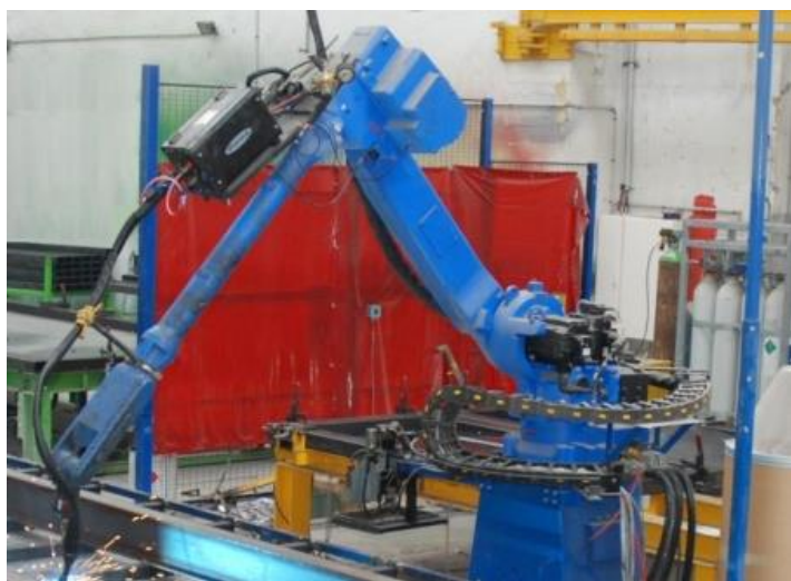
Robot de soudure