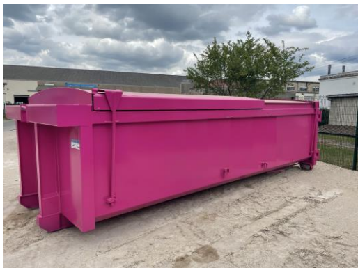
• Benne ROK, 15m 3 Toits coulissants,