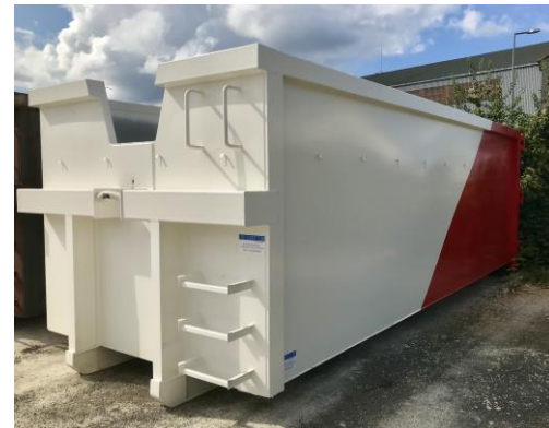
• Benne ROK- 30m 3 "V" Bicolore