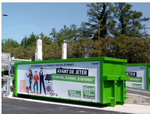
• Benne ROK - 30m 3 Déco