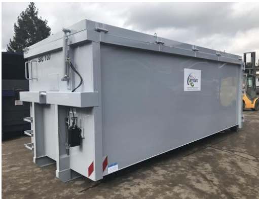
• Benne ROK - 30m 3 Toit hydraulique