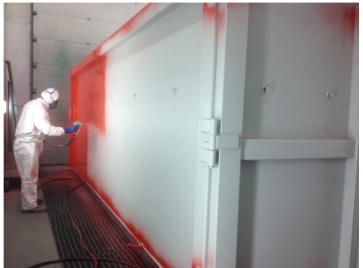
Cabine de peinture