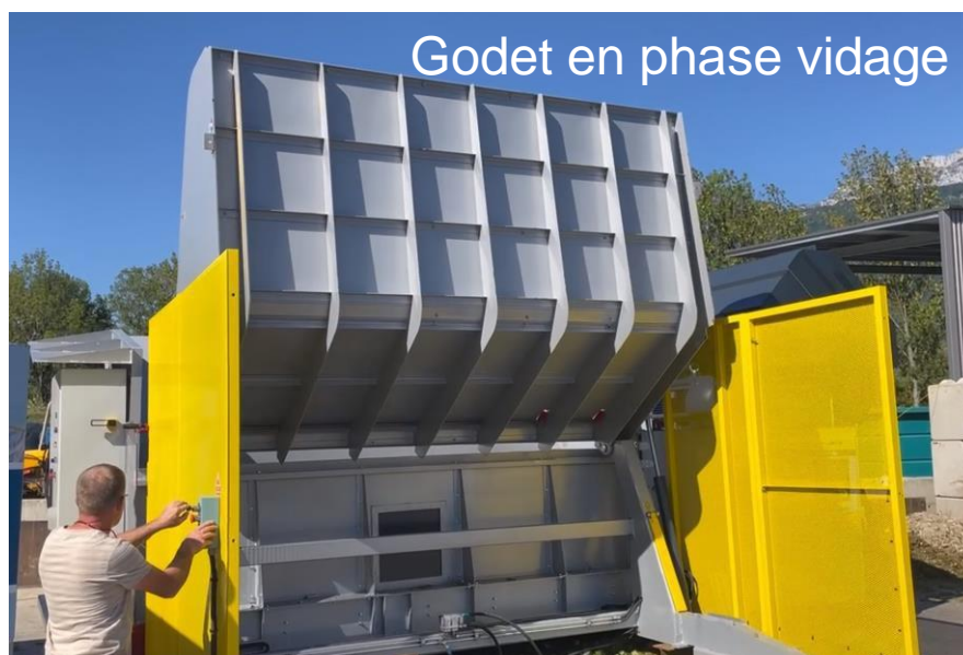
Godet en phase vidage