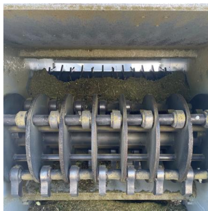
Broyeur avec outils oscillant