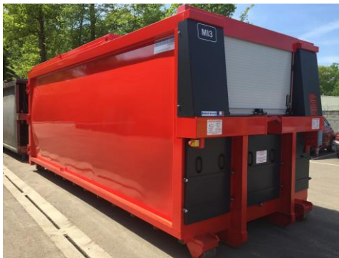
• Options : Rideau de fermeture,