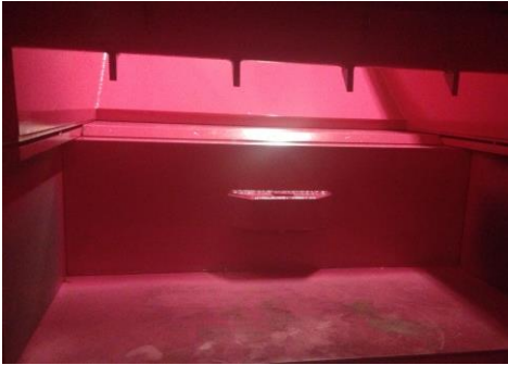
• Vue intérieure: grande pénétration du bouclier ( Inside View Rammer plate )

The PAKTOR Mi3 is a new concept in patented monobloc compactors