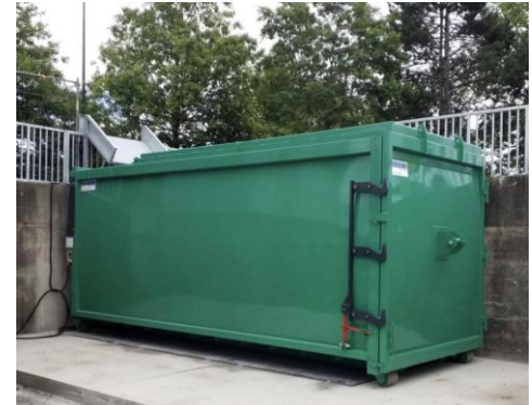
• Version à quai ( Docked version )