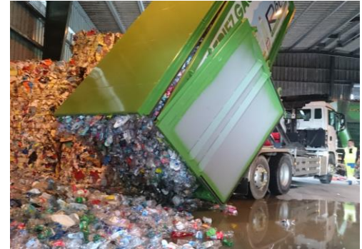
• Toit ouvrant ( Opening roof )