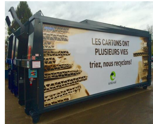
• Option DEKO-Compacteur ( Optional DEKO Compactor )