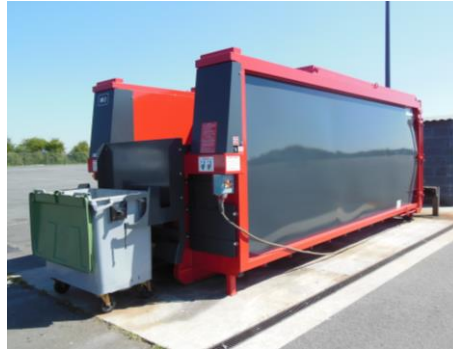
• Lève conteneurs ( Bin Lifter )