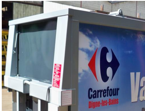
• Capot de fermeture ( Closing cover )