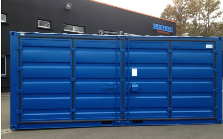
Conteneur 20' porte latérale 4 vantaux