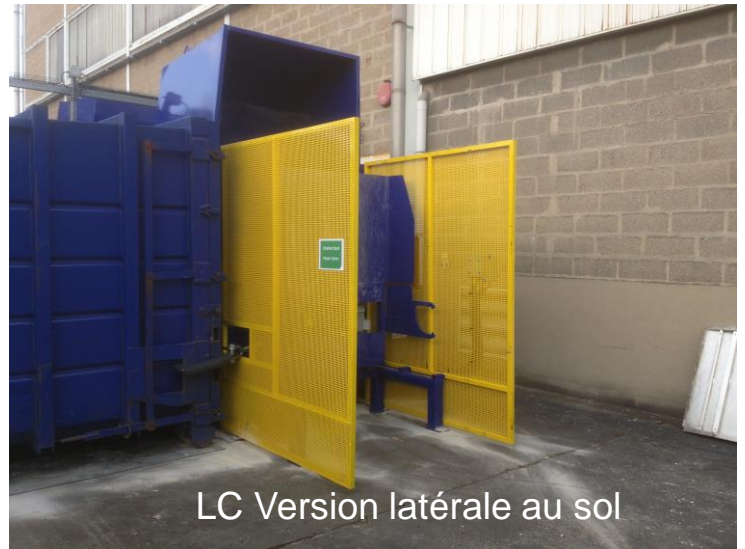
LC Version latérale au sol