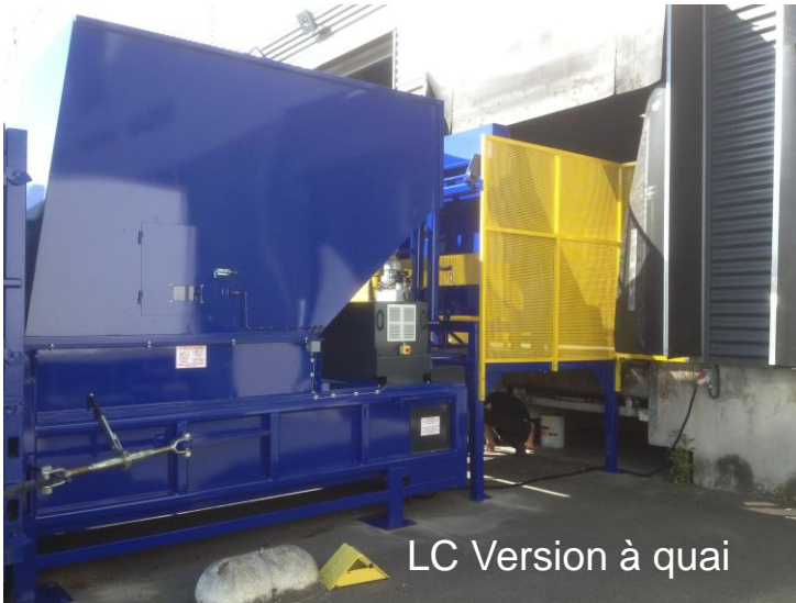
LC Version à quai