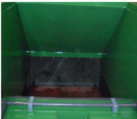
Auget grande dimension, sans aspérité pour éviter la rétention des déchets