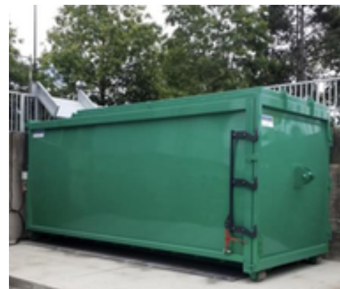
Version à quai