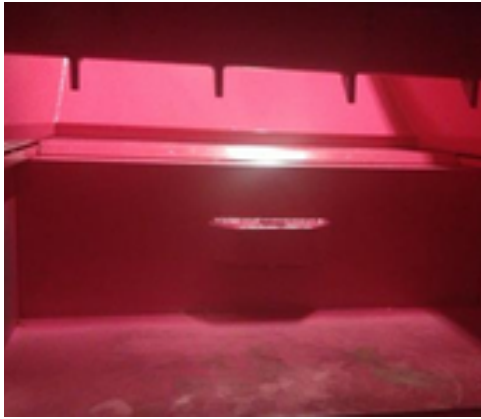
Vue intérieure: grande pénétration du bouclier