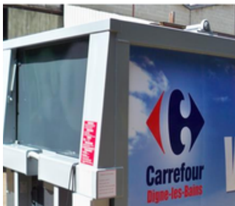
Capot de fermeture