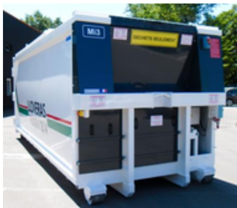
Tôle de mise à quai, capot compensé, commande à distance