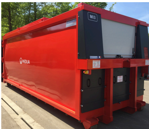
Option rideau de fermeture