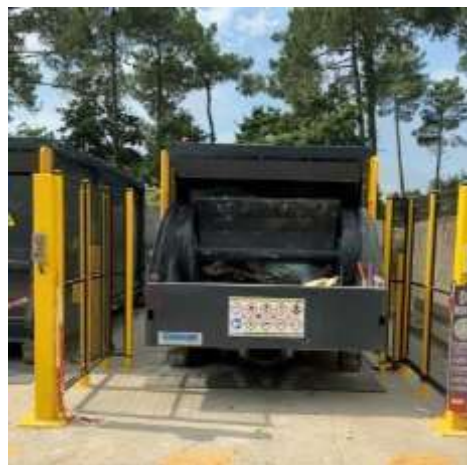
Faible hauteur de chargement