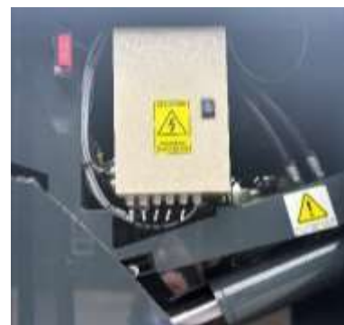
Porte d'accès à l'armoire électrique et au vérin de compaction (depuis le sol)