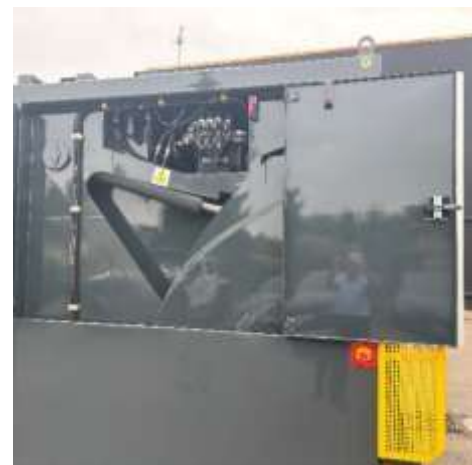
Portes pour accès au vérin de compaction et à l'armoire électrique