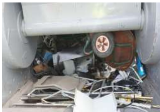
Pelle de compaction