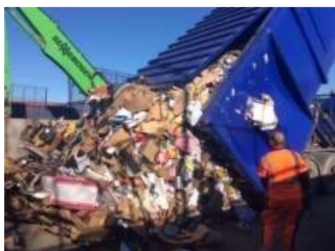
Toit ouvrant pour faciliter le vidage des déchets