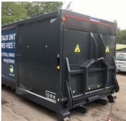
Anneau de préhension sur le godet de chargement