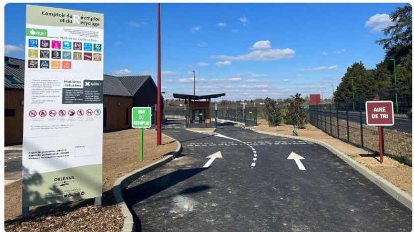
La nouvelle déchetterie a été inaugurée à Saint-Pryvé-Saint-Mesmin

On ne se croirait presque pas dans une déchetterie, sur ce nouveau site de 2 hectares installé à Saint-Pryvé-Mesmin. Les panneaux indiquent "Aire de tri" et "Quai du réemploi" . Des termes savamment choisis par la métropole pour cette nouvelle déchetterie, qui vient remplacer celle de la rue Hatton, au sud d'Orléans. "Il faut qu'on aille sur de nouvelles approches, avec de nouveaux tris" , assure Thierry Cousin, vice-président à la métropole d'Orléans chargé de la gestion des déchets.