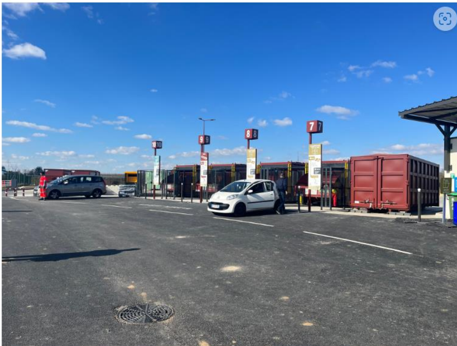
Les bacs de tri où les usagers peuvent déposer leurs déchets à recycler