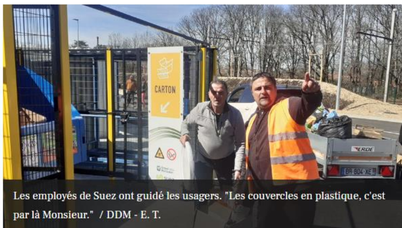
Les employés de Suez ont guidé les usagers. "Les couvercles en plastique, c'est par là Monsieur."

Au total, Econord comporte une quinzaine d'emplacements qui incitent à trier plus finement ses déchets. Matériel de sport et de loisirs, jouets, outils de bricolage ou de jardin ont par exemple un espace dédié.