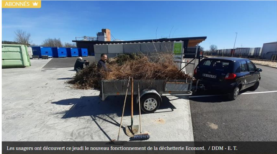
Les usagers ont découvert ce jeudi le nouveau fonctionnement de la déchetterie Econord.