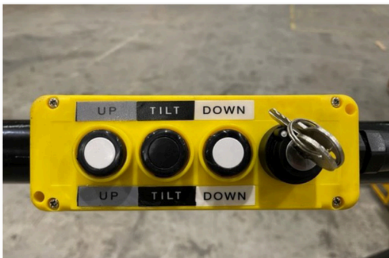
Boitier de commande