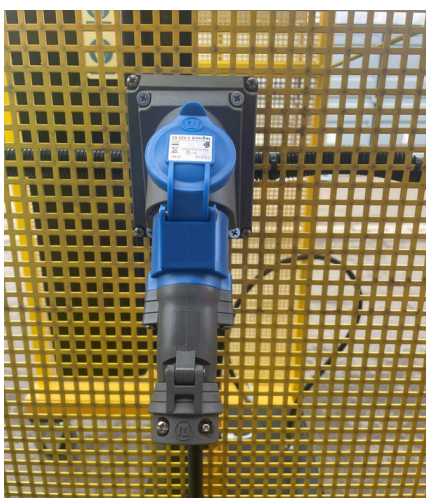
Prise électrique pour recharge de la batterie

Vider des charges lourdes dans des bennes et conteneurs en assurant la sécurité de votre opérateur.