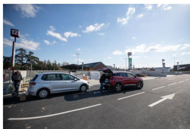
Lundi 27 février, 1er jour de la mise en service du lieu, 200 véhicules ont fréquenté les lieux.