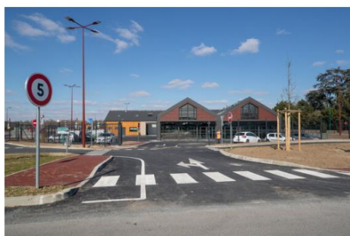
L'ensemble du site est conçu pour que l'usager ait la possibilité d'offrir à ses objets et matières les solutions de valorisation les plus vertueuses au fil de son cheminement.