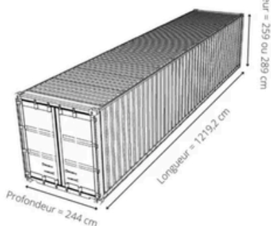
Vue de 3/4